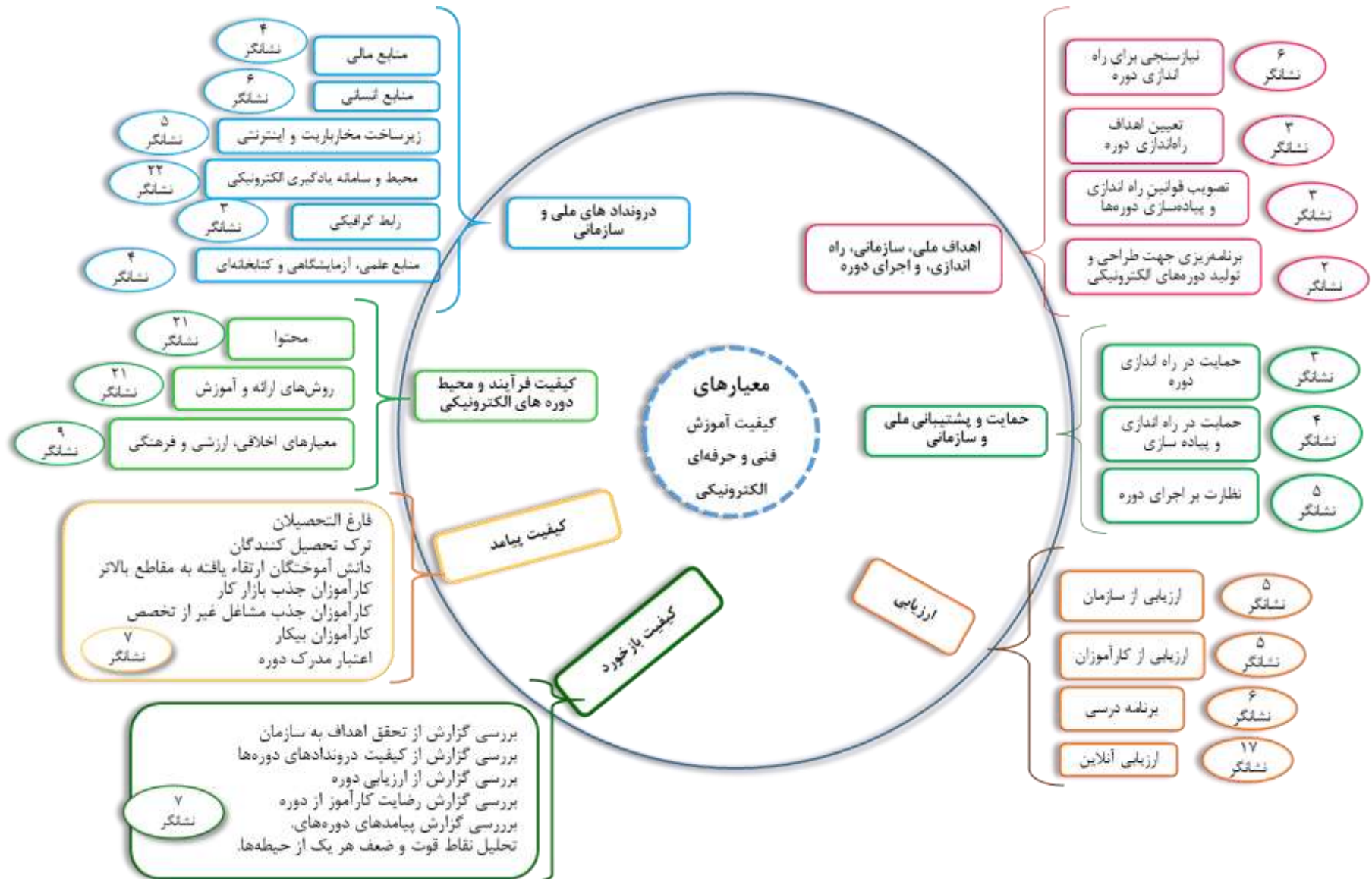
شکل (۱) تصویری کلی از حیطه‌ها، معیارها و تعداد نشانگرها (برای مشاهده کامل نشانگرها در قالب جداول به پیوست طرح مراجعه شود).